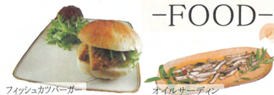
フィッシュカツバーガー オイルサーディン