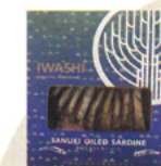
オイルサーディン