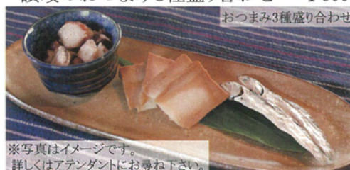
※写真はイメージです。 詳しくはアテンダントにお尋ね下さい。