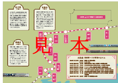
記念台紙 イメージ（ナカ）

※記念台紙サイズ（見開き） 縦 182mm × 横 257mm ※デザインは予告なく変更となる場合があります。