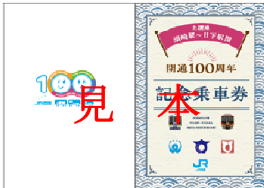
記念台紙 イメージ（オモテ）