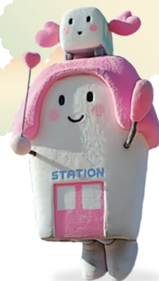
JR四国公式イメージキャラクター すまいるえきちゃん