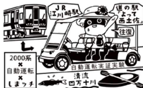
【押印できるスタンプ】