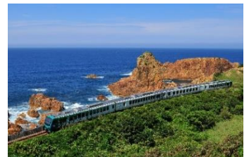
リゾートしらかみ