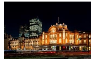
東京ステーションホテル（外観夜景）