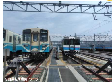
松山運転所構内イメージ