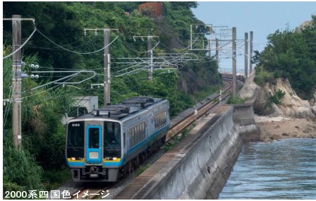
2000系四国色イメージ