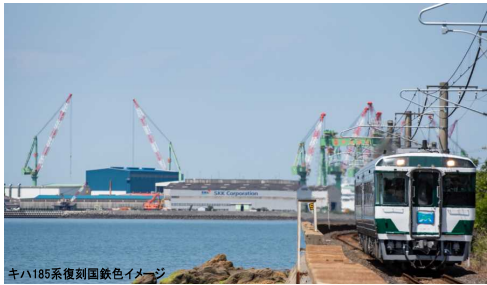
キハ185系復刻国鉄色イメージ