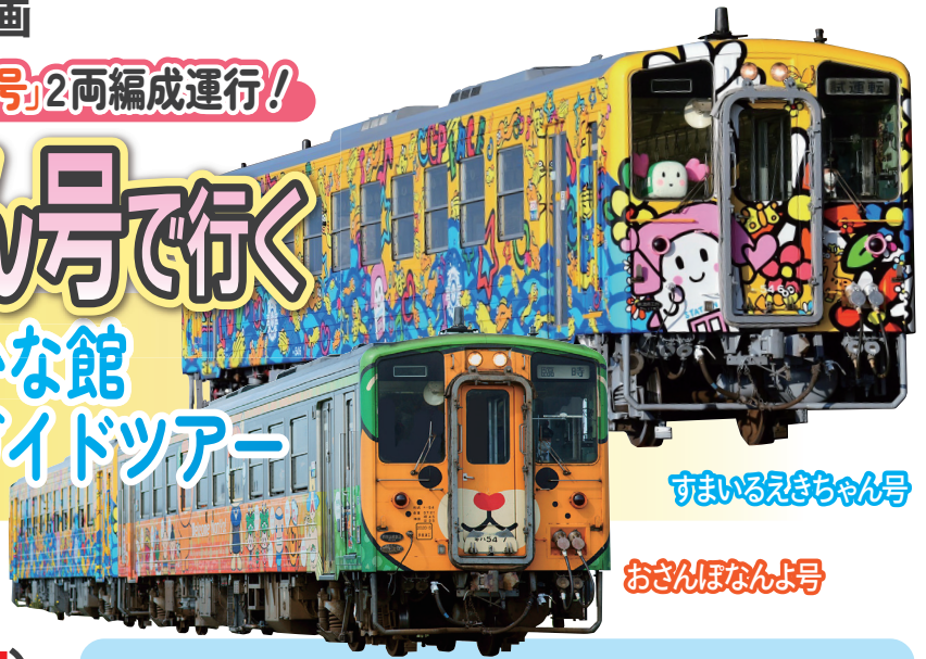
すまいるえきちゃん号