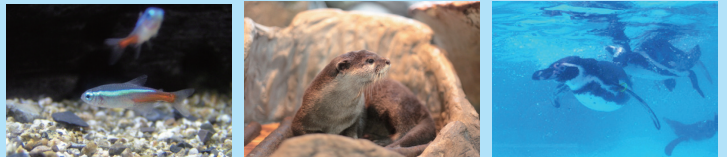
※気象状況等により、内容が一部変更となる場合がございます。※掲載の写真およびイラストはすべてイメージです。

日本一の清流 四万十川をはじめとする淡水に棲む魚たちを中心に、上流から河口域までの生き物が飼育展示されています。また、ツメカワフウや愛らしいペンギンたち、二足立ちするワニなど個性あふれる動物たちにも出会えます。今回のツアーでは飼育員さんによる特別ガイドのもと館内を回ります。