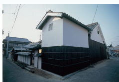
家プロジェクト 角屋 宮島達男 「Sea of Time '98」1998 / 2018