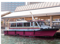
チャーター船(イメージ) 株式会社タコトコ海上タクシー