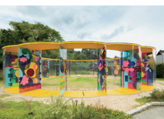
犬島「家プロジェクト」A ベアトリス・ミラーゼス 「Yellow Flower Dream」2018