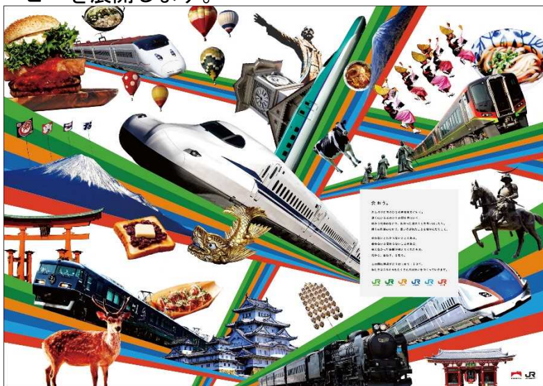
ポスター（イメージ）

全国のJRの駅にて、JR各社の6色ラインをベースに、お客さまの想いをのせた列車が日本中を駆け抜け、各地を繋いでいる様子を表現したポスターやスペシャルムービーを展開します。