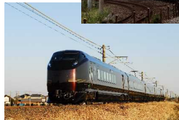
旅行商品で利用する列車（イメージ）