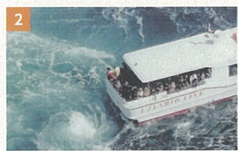
2 亀浦漁港(うずしお汽船)