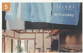
5 STUDIO N2(藍染工房)