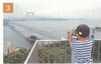
3 エスカヒル・鳴門(展望施設)