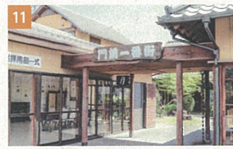
11 門前一番街(土産物店)