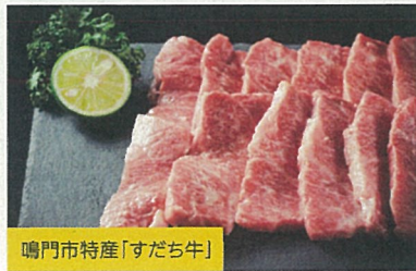
鳴門市特産「すだち牛」

対象スポットを巡り、6つ以上のスタンプを集めて応募すると、鳴門市特産の希少な「すだち牛」や大塚国際美術館の入館券など、ステキな賞品が抽選で当たります。 ※写真はイメージです