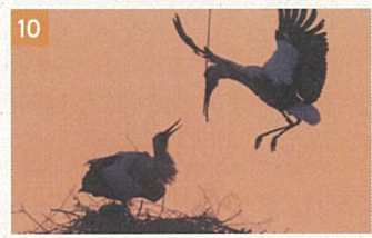
10 鳴門のコウノトリ(ウォッチングスポット)