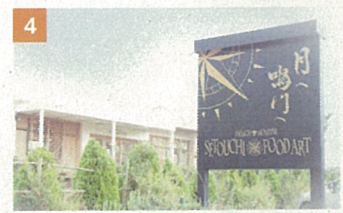
4 フレンチモンスター 瀬戸内フードアート(洋菓子店)