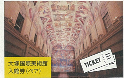
大塚国際美術館 入館券(ペア)