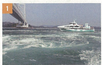
1 亀浦観光港(うずしお観潮船)