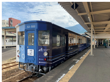
藍よしのがわトロッコ号（イメージ）