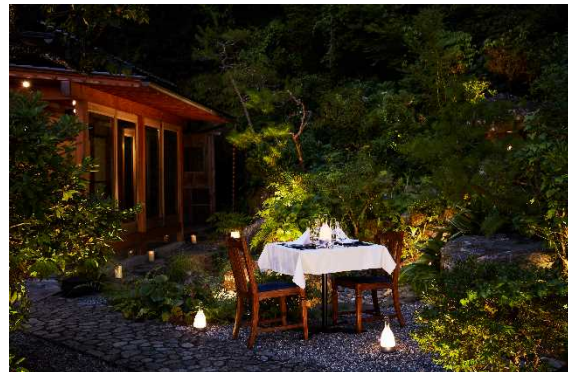
大人の旅路と晩餐会～プレミアムダイニング in 大洲～イメージ