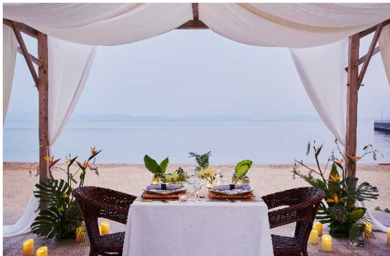
大人の旅路と晩餐会～プレミアムダイニング in 西予～イメージ

JR 四国では、2021年10月～12月に開催される四国 destinations キャンペーンの一環として、愛媛県西予市・大洲市で当ツアー限定のプレミアムな野外レストランをお楽しみいただける募集型企画旅行「四国 DC 特別企画 大人の旅路と晩餐会～プレミアムダイニング～」を8月13日（金）より発売開始いたします。