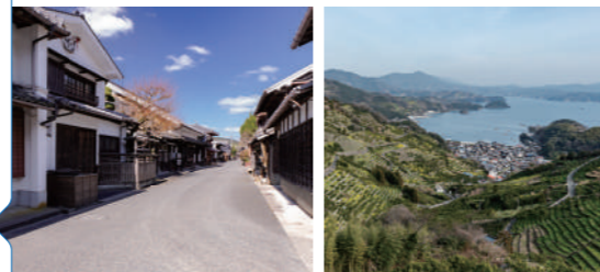
重伝建散策 卯之町の町並み 狩浜の段畑と 農漁村散策

お一人様 四国各駅発着 22,000円(税込) 募集人数: 30人 宿泊希望の方はオプションをご利用ください