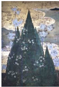
妙蓮寺「鉢杉図」 （重要文化財）