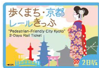
＜歩くまち・京都レールきっぷ（2日版）券面＞