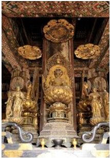
東寺 五重塔（国宝）内部