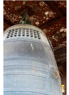
方広寺「国家安康」の梵鐘 （重要文化財）

JRグループでは、2021年1月から3月にかけて京都市、公益社団法人京都市観光協会（DMO KYOTO）と連携した京都デスティネーションキャンペーン「京の冬の旅」を実施します。第55回目を迎える今回は「京都に見る日本の文化」をメインテーマに、「非公開文化財特別公開」をはじめ、テーマに合わせて定期観光バスで巡る特別コースなど、多彩なイベントを実施します。