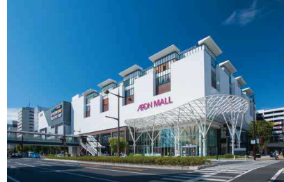
【イオンモール岡山】