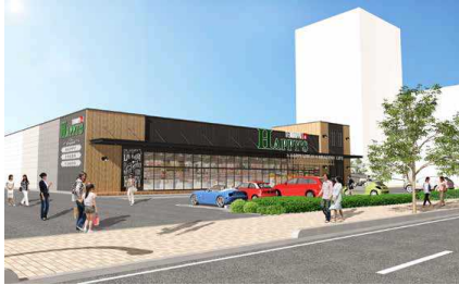
【天満屋ハピーズ昭和町店】

周辺施設には、「イオンモール岡山」(徒歩5分)や「奉還町商店街」(徒歩10分)などがあり、生活利便性が高い立地にあります。また、「厳井東公園」(隣接)や「岡山市立石井幼稚園」(徒歩6分)や「岡山市立石井小学校」(徒歩7分)、「済生会病院」(徒歩17分)など医療・教育施設、公園なども充実しています。