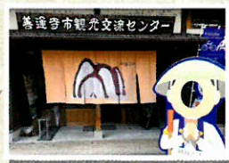
4 善通寺市 観光交流センター

弘法大師が唐から麦の種を持ち帰ったという伝説が残る、モチモチとした食感 & フチフチとした歯ごたえが特徴の讃岐もち麦ダイシモチを使用した特産品