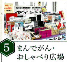
5 まんでがん・おしゃべり広場