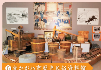
⑥ 東かがわ市歴史民俗資料館

東かがわ市の地場産業のほか、地域の歴史・民俗に関する資料が展示された資料館。砂糖づくりに必要な道具などを見ることができます。