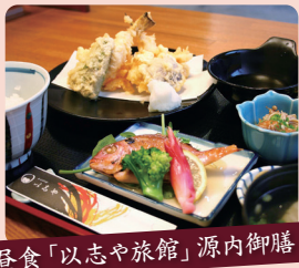
昼食「以志や旅館」源内御膳

有形文化財に登録された明治創業の旅館で「平賀源内」にまつわる料理を楽しめます。(メニューはイメージです)