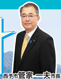
西予市 管家一夫市長

西予市は、自然を科学の目で楽しめる「ジオパーク」に認定されているまちです。今回訪れていただくのは、四国西予ジオパークの見どころの一つ「狩浜の段々畑」です。リアス海岸の急傾斜に築かれた石灰岩の石垣の上で、県内有数の柑橘栽培が行われており、集落には狩浜のくらしや生業の変遷を伝える景観が残されています。どうぞお楽しみください。