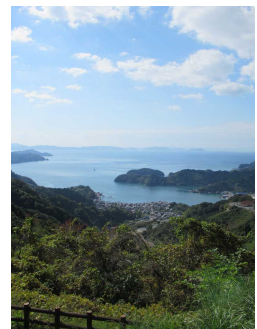
▲野福峠からの眺望

3 行程・ご旅行代金等 四国内各地から卯之町駅までのJR往復（一部特急自由席）＋貸切バス、西予市狩浜地区の段々畑巡りなどがセットになった募集型企画旅行として募集します。 ※行程・ご旅行代金は添付のパンフレットをご覧ください。