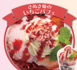
香川県産ブランドいちごを 贅沢に使用