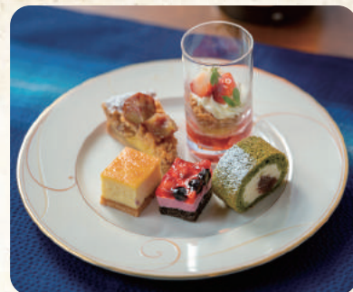
"四季の移ろい"をテーマに5品ずつの スイーツワンプレートが3種類登場