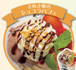
伝統のパリライアイスと 共に