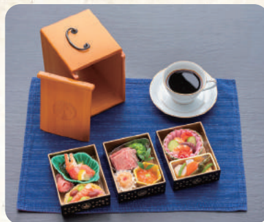
ボリューム満点のスイーツにぴったりの 特製和軽食を遊山箱に